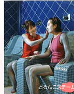
どろんこスチーム