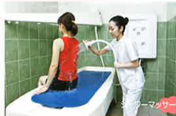
フォームマッサージ