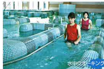
水中ウォーキング

全国には珍しい温泉水のプールで、首、肩、腰、足などの各部分、14種類のゾーンに分かれたジェット水流を設置。周遊するだけで自然と運動にもなり、散歩しながら緊張がほぐれ心身のバランスを整えます。 メタボ対策・病後のリハビリ・運動不足解消 などにおすすめです。