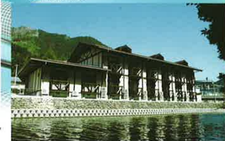
木の香漂う山あいの宿 宝泉坊ロッジ