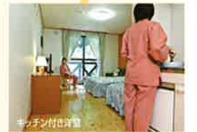
キッチン付き洋室