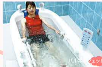
パルベージェット